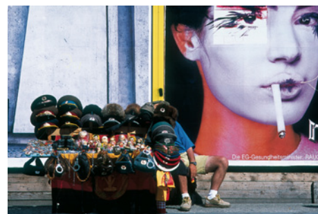
Vera Rüttimann, Schnittstelle, Fotografie